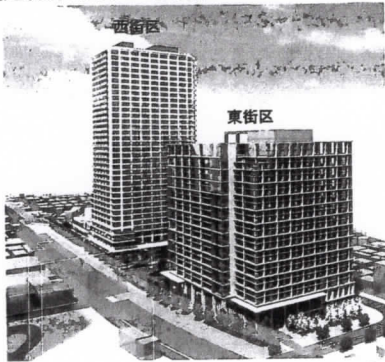
【建物外観イメージ図】

立石駅北口地区の街づくりについて、北口地区準備組合は、11月末に再開発事業の内容と都市計画手続きのスケジュール等について権利者に説明を実施し、今後、区は、平成29年度中の都市計画決定に向け手続きを行っていくとの説明が行われました。【断面構成図】